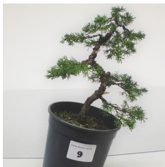
Ginepro dopo la prima impostazione

Workshop - Prima impostazione di un pre-bonsai.