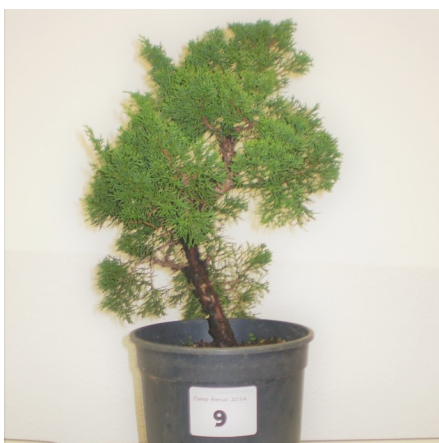
Ginepro prima dell'impostazione

Cos'è il bonsai. Il bonsai e i suoi stili.